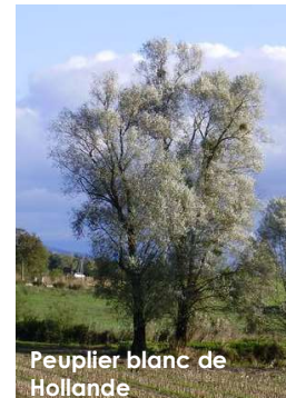
Peuplier blanc de Hollande